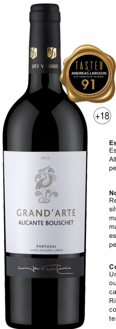
GRAND'ARTE TINTO 22 VINHO REGIONAL LISBOA ALICANTE BOUSCHET 13% | BARRICA 3 MESES